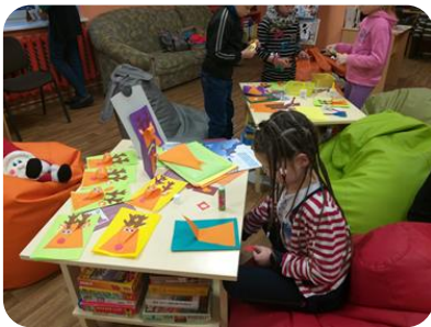
Radošā pēcpusdiena "Rūķu darbnīca" Bērnu nodaļas lasītavā