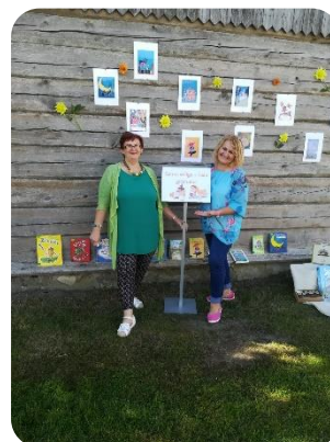
DNCB ar staciju pasākumā "Vari, dari pirmklasniek"