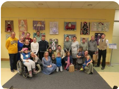
Personu ar invaliditāti un viņu atbalstītāju biedrība «Laimiņa» izstādes atklāšana