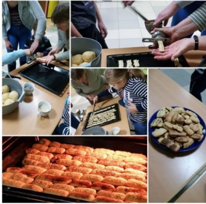
Zebrenes pagastā pasākumā “Reiz bija, ir un būs” tiek atgādināts par kulināro mantojumu