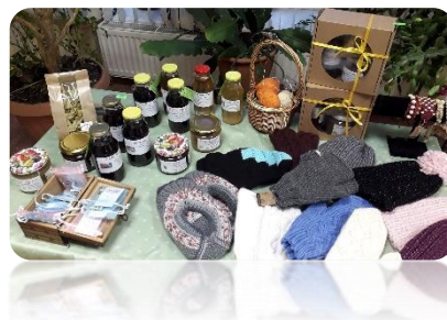
Mājražotāju "Lauku labumu izstāde" Tērvetes bibliotēkā