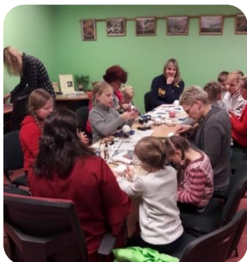
Ziemassvētku rotājumu meistarklase Jaunbērzes bibliotēkā