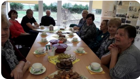
Kulināro stāstu pēcpusdiena “Mana bērnības garša” Aizstrautnieku bibliotēkā