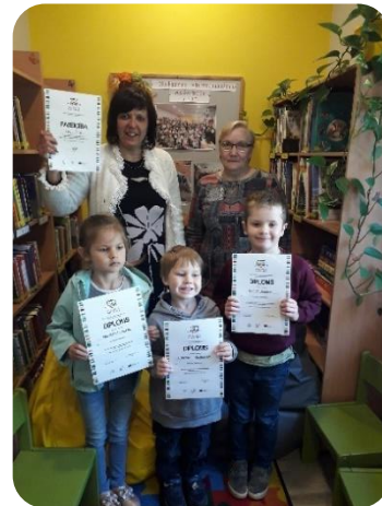
Projekts "Mūsu mazā bibliotēka" Penkules bibliotēkā