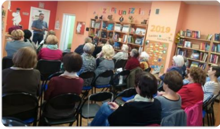
Muzikālā dzejas pēcpusdiena un A.Kārkliņa grāmatas atvēršanas svētki Auces bibliotēkā