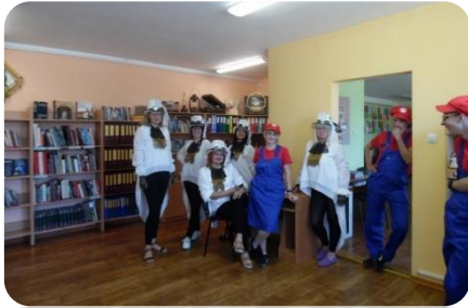
Piedzīvojuma brauciens “AnneBiZe-2019”- kontrolpunkts Annenieku bibliotēkā.