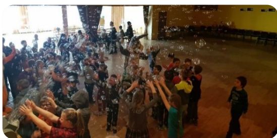
Projekta “Bērnu, jauniešu un vecāku žūrija” noslēguma pasākums Penkules, Šķībes, Jaunbērzes, Bikstu bērniem, kas lasīja projekta grāmatas