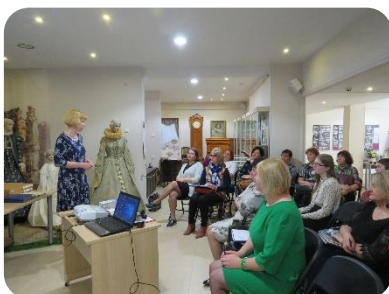
Seminārā Dobeles novadpētniecības muzejā