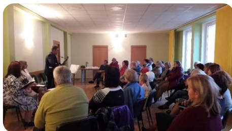
Literārs pasākums Annenieku bibliotēkā “Dzejas varavīksnes lokā”