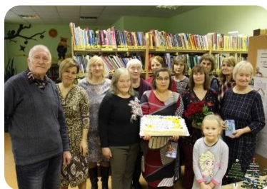
Tērvetes bibliotēkas 110.gadu jubilejas pasākums