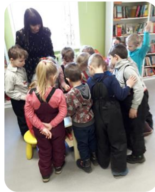
Tematiskais rīts "Mans mīldzīvnieks" PII "Vecauce" Auces bibliotēkas Bērnu nodaļas abonementā