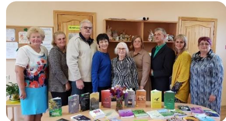
Dzejas diena Bikstu bibliotēkā