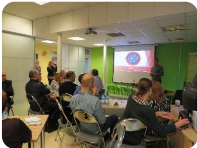
Erudīcijas spēle "Latvija"