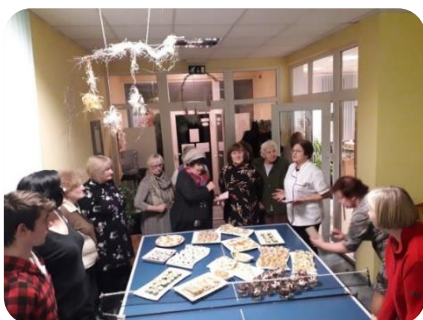
Meistarklase "Galda klāšana svētkiem" Šķibes bibliotēkā