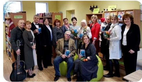
Bikstu dzejnieku kopkrājuma “Upes krastu elēģija” atvēršana Bikstu bibliotēkā