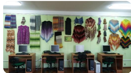
Naudītes pagasta rokdarbnieču darbu izstāde Annenieku bibliotēkā