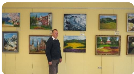
Voldemāra Krutina gleznu izstāde