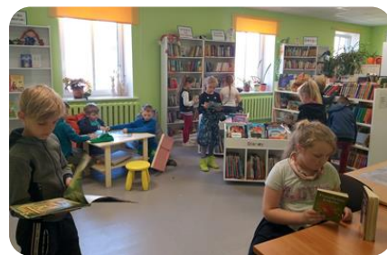
Viena no bibliotekārajām stundām Auces vidusskolas sākumskolas klasei Bērnu nodaļas abonementā