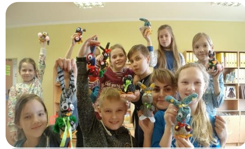
Skolēnu brīvlaika aktivitātes Bīkstu bibliotēkā