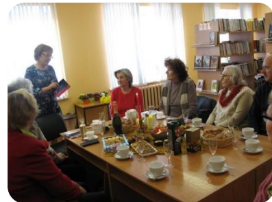
Dzejas krājuma “Sapņi varavīksnes lokā” atvēršana.