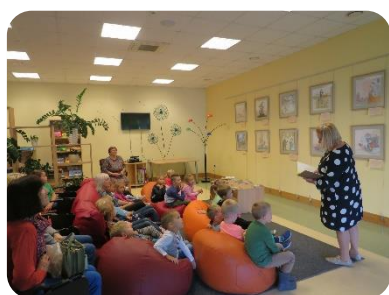
Bibliotekārā stunda “Teikas par Dobeles pili”