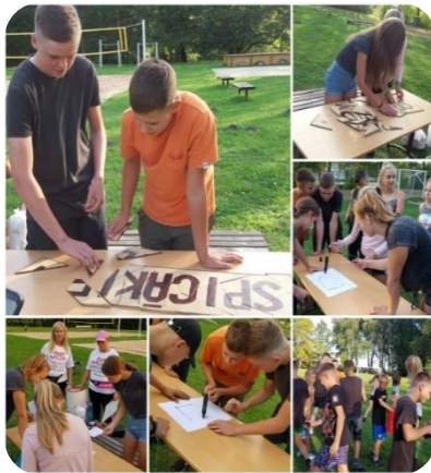
Citāda zinību diena bērniem Zebrenes pagastā