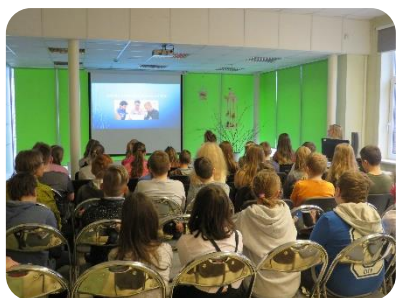
Nodarbība skolēniem “Drošs internets sākas ar tevi”