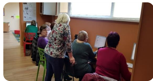
Bikstu pagasta iedzīvotāji apgūst datorprasmes un iepazīst bezmaksas datubāzes