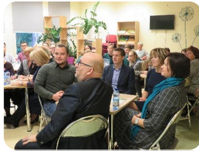
Erudīcijas spēle "Latvija"