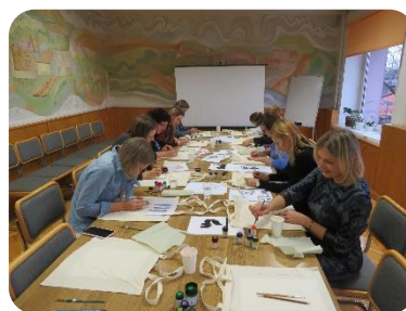
Vadījam radošo darbnīcu Dobeles novada pašvaldības darbiniekiem "Mans grāmatu maisiņš"