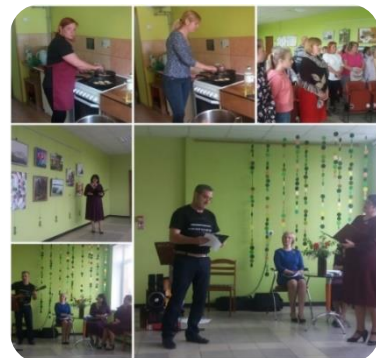
Baltā galdauta svētki Zebrenes pagastā