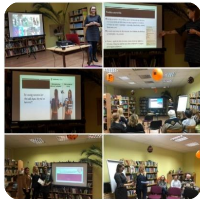
“Bez diētām un bez badošanās...” lekcija par veselīgu uzturu Zebrenes bibliotēkā