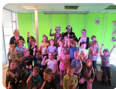
Bērnu, vecāku un jauniešu žūrijas noslēguma