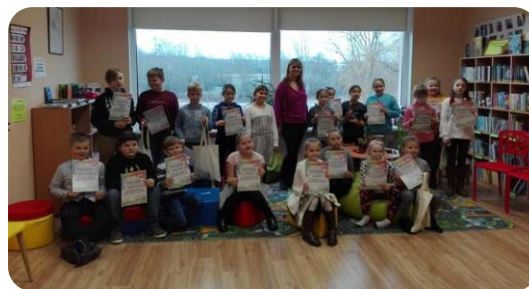
Zīmēšanas konkursa noslēguma pasākums Bikstu bibliotēkā