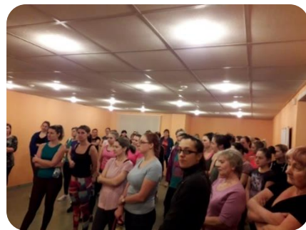
Zumbas nodarbības Šķībē, sadarbībā ar Šķībes bibliotēku