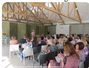
Organizējam LBB Zemgales nodaļas vasaras semināru atpūtas bāzē "Niedras"