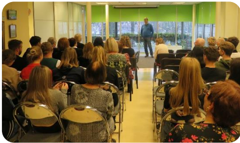
Tikšanās ar rakstnieku Arno Junzi (VKKF atbalstīts projekts)