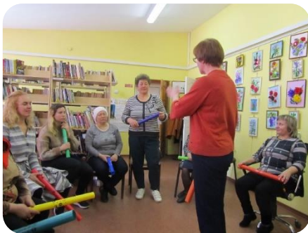
Mūzikas terapija, kas tas ir? Teorētiskā un praktiskā nodarbība Lejasstrazdu bibliotēkā