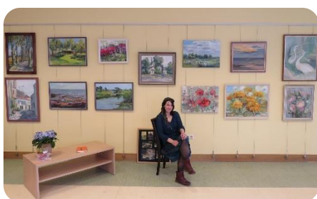
Novadnieces Annas Kaltiginas gleznu izstāde