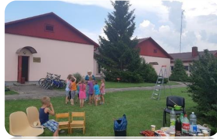
Pikniks bērniem pie Aizstrautnieku bibliotēkas “Stāsti zaļā pļavā”