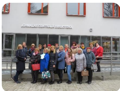
Pieredzes apmaiņa Jūrmalas bibliotēkā