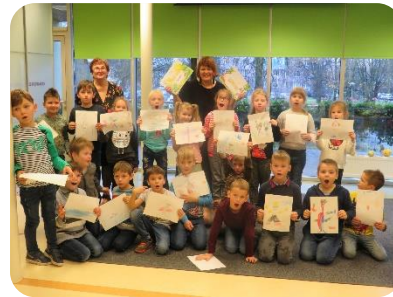
Tikšanās ar rakstnieci Inesi Valteri