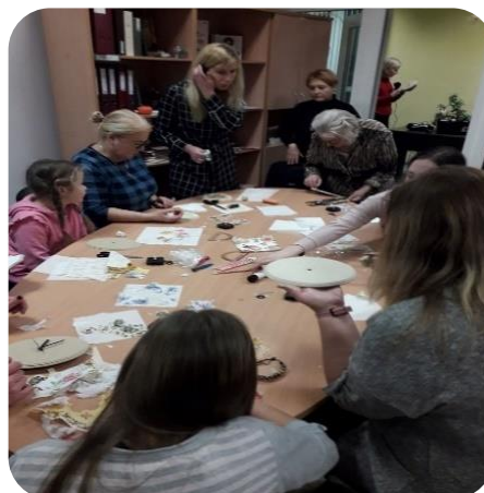
Dekupāžas radošā darbnīca Šķibes bibliotēkā