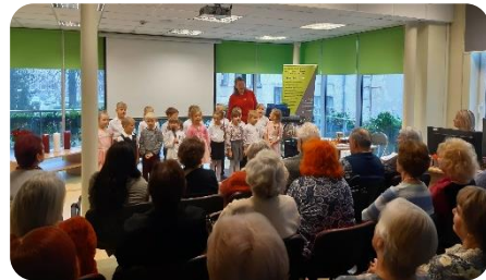
Tikšanās bibliotēkā (pasākums senioriem)