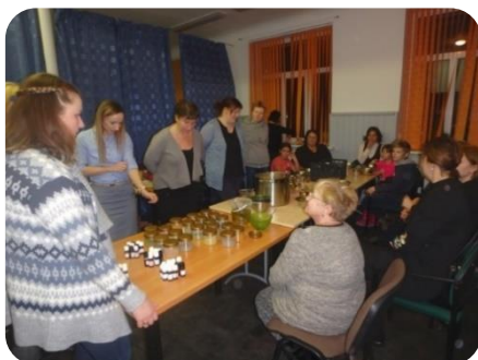
Sāls scrubju gatavošanas meistarklase Krimūnu bibliotēkā