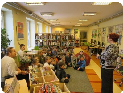
Bibliotēkā stunda par Margaritas Stārastes grāmatām