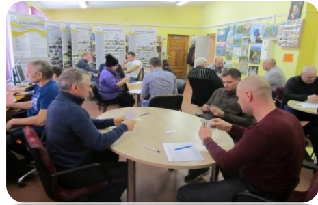
Zolītes sacensības Lejasstrazdu bibliotēkā