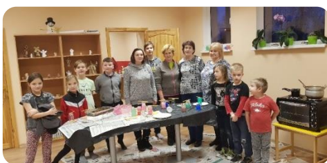
Sveču liešanas meistarklase Bīkstu bibliotēkā