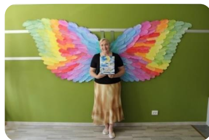
Fotodarbnīca “Es un grāmata” Penkules bibliotēkā