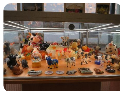
Novadnieces Rutas Rogas gotiņu kolekcija