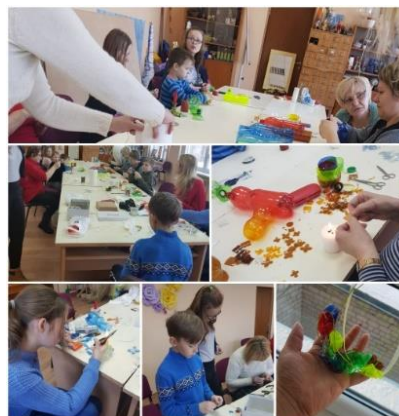
Nodarbību cikls “Domāt zaļi” Zebrenes bibliotēkā