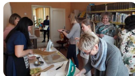
Bišu vaska drāniņu gatavošanas meistarklase Jaunbērzes bibliotēkā