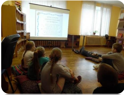
Literārā stunda Annenieku bibliotēkā