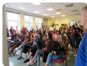
DVĢ audzēkņi iepazīst bibliotēkā pieejamos pakalpojumus un datubāzes