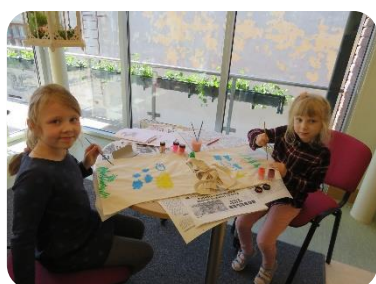
Radošā darbnīca “Dāvana māmiņai”