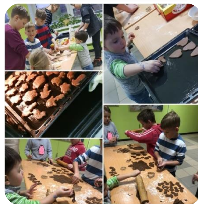
Eglītes iedegšanas pasākums Zebrenē