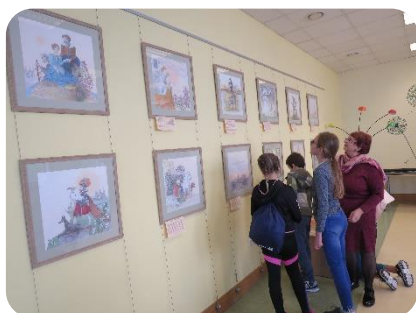
Izstāde "Teikas par Dobeles pili"