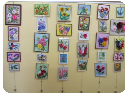
Annas Lapenkovas izstāde “Ziedi virpulī” Lejasstrazdu bibliotēkā