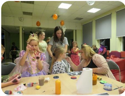
Helovīnu pasākums bibliotēkā