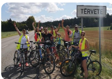
Pasākums , izbrauc izskrien un izsoļo Tērvetes novadu.