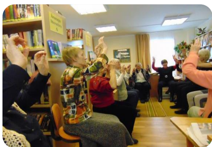
“Kustinācija” nodarbība Bites bibliotēkā