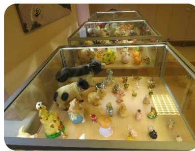
Novadnieces Ilgas Līcītes cūciņu kolekcija