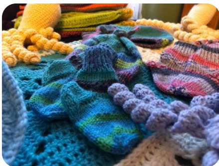
Jaunbērzes bibliotēkā sarūpētais sūtījums “Sirds Siltuma darbnīcai” priekšlaikus dzimušiem bērniņiem