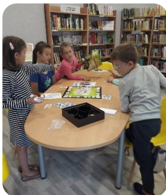
"Domā, prāto, spēlē" Penkules bibliotēkā