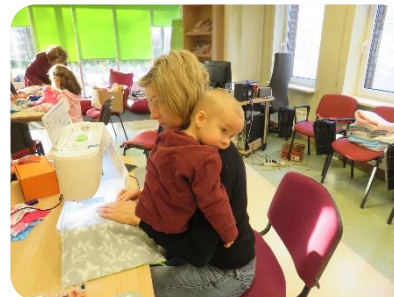
Radošā darbnīca "Miega zaķis mazulim"