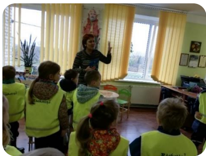
Bērnudārza bērni iepazīst Annenieku bibliotēku