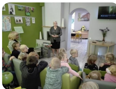
Dzejas stunda pirmsskolas vecuma bērniem Penkules bibliotēkā