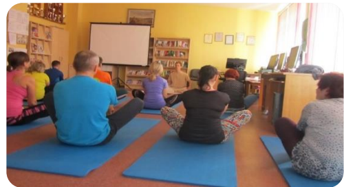
Upa JOGA Praktiskā un teorētiskā nodarbība Lejasstrazdu bibliotēkā