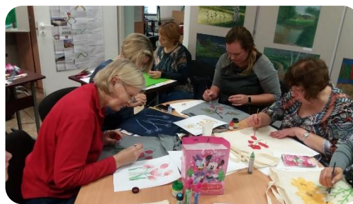
Audumu maisiņu apgleznošanas meistarklase Šķibes bibliotēkā