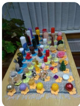
Sveču izstāde Augstkalnes bibliotēkā