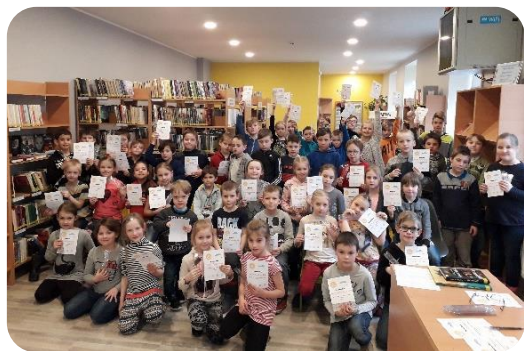
“Bērnu, jauniešu un vecāku žūrijas ekspertu tikšanās aprīlī” Penkules bibliotēkā