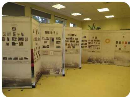
Ceļojošā izstāde "Vaira Vīķe Freiberga. Ar sauli."