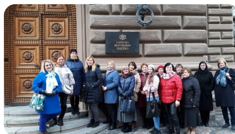
Iepazinām Latvijas Republikas Saeimu un Saeimas bibliotēku