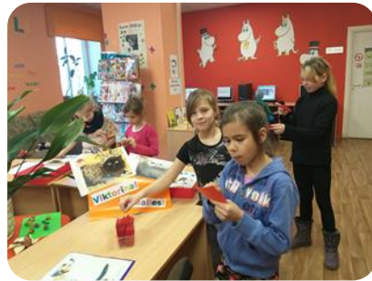
Viktorīna "Mans mīldzīvnieks" Bērnu nodaļas lasītavā Auces bibliotēkā