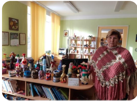
Rokdarbnieces S.Abramovičas dekupāžas darbi Annenieku bibliotēkā