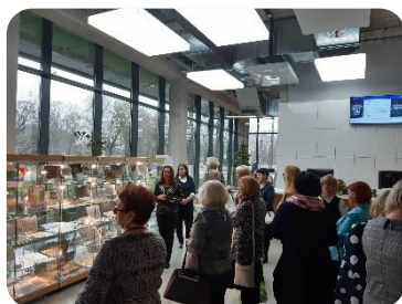
Pieredzes apmaiņā Latvijas Universitātes Akadēmiskajā centrā