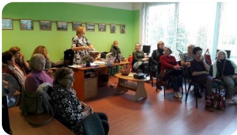
Veselīga uztura nodarbību cikls “Visi par un ap veselīgu uzturu” Jaunbērzes bibliotēkā