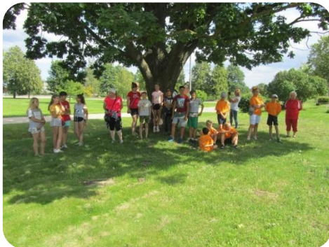
Foto orientēšanās sadarbībā ar Šķibes, Jaunbērzes un Lejasstrazdu bibliotēkām