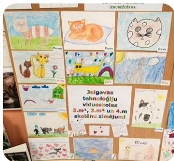
Zīmējumu izstāde "Mans mīldzīvnieks" Bērnu nodaļas lasītavā