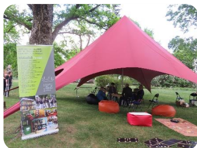
DNCB piedalās ar āra lasītavu Dobeles novada svētkos