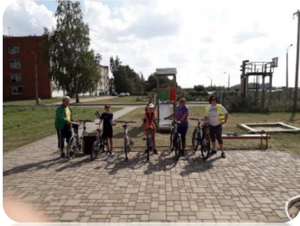
Velobrauciens "Ripojam pa vasaru" Šķibes pagastā