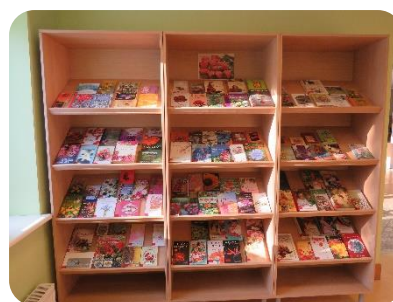
Plauktu izstāde "Visos logos rozēs zied"