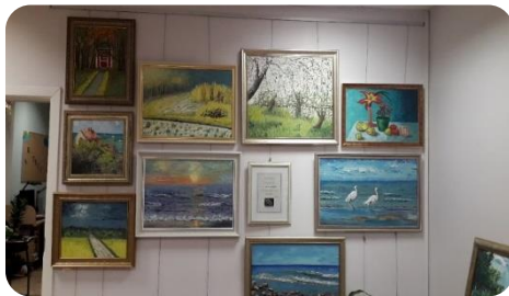
Novadnieces Nellijas Empeles gleznu izstāde Šķības bibliotēkā