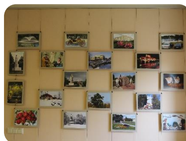
Novadnieka Staņislava Kurmja fotogrāfiju izstāde