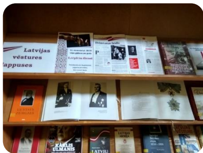
Izstāde "Latvijas vēstures lappuses" Augstkalnes bibliotēkā