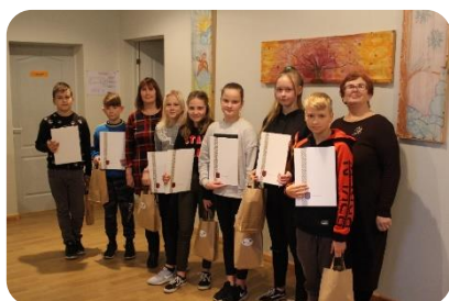
Tērvetes bibliotēkas konkursa „Skaļā lasīšana” 2019.gada dalībnieki.