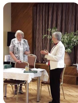
Grāmatas „Latviešu biedrības nami: vēsture vai nākotne” prezentācija Bukaišu pagastā