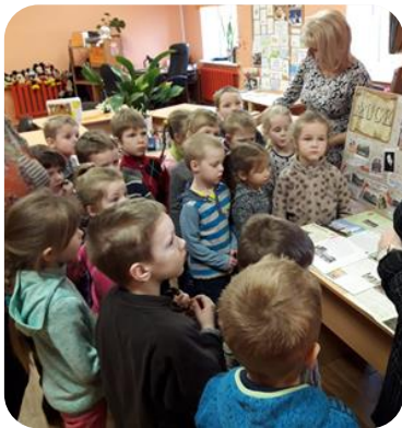
Tematiskais rīts "Auces vārda dienā" Bērnu nodaļas lasītavā Auces bibliotēkā