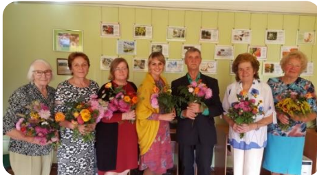
Dzejas diena Bikstu bibliotēkā