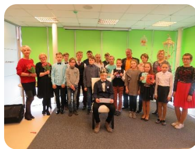
Nacionālās Skaļās lasīšanas sacensības DNCB (pusfināls)