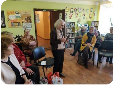
Atmiņu pēcpusdiena “Annenieku bibliotēkai – 110”