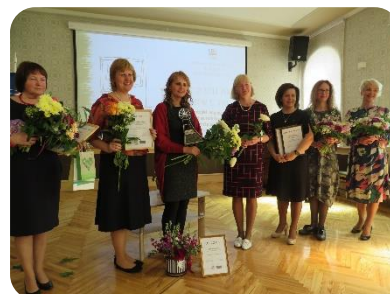
Bikstu bibliotekāre tiek apbalvota kā Gada bibliotekārs Zemgalē